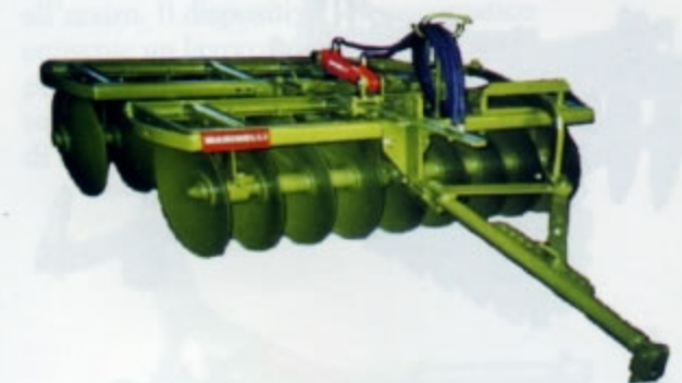
ERPICI FRANGIZOLLE A DISCHI PORTATI-TRAINATI a 2 sezioni "V" Monotrave serie Economy Disponibile di serie: nelle versioni da 16 a 24 dischi (da Kg 580 a Kg 1.270).