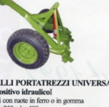
CARRELLI PORTATREZZI UNIVERSALI con dispositivo idraulico disponibili con ruote in ferro o in gomma peso da kg.250 a kg.400