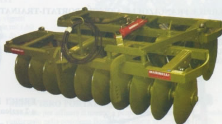
ERPICE DISSODATORE. Adatto per la lavorazione di sodi, stoppie o terreni sporchi. La profondità massima di lavoro è di 30 cm circa. Mediamente la capacità giornaliera di lavoro è di 14-15 ettari. Di serie da 18 a 24 dischi. (Peso da 1950 a 2450).