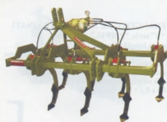
COLTIVATORE IDROPNEUMATICO SERIE HOBBIT. Con dispositivo di sicurezza idropneumatico. Grazie al sistema idropneumatico risulta adatto a qualsiasi tipo di terreno (sassoso, sciolto etc.) Può essere utilizzato per estirpare o per lavorare sodi o stoppie fino ad un massimo di 35cm di profondità. Di serie da 5 a 11 ancore.