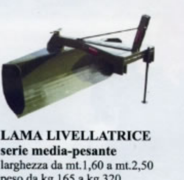
LAMA LIVELLATRICE serie media-pesante larghezza da mt.1,60 a mt.2,50 peso da kg.165 a kg.320