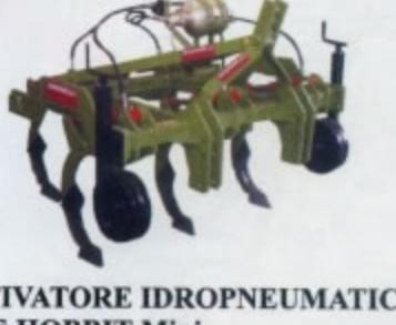
COLTIVATORE IDROPNEUMATICO SERIE HOBBIT Mini. Con dispositivo di sicurezza idropneumatico. Grazie al sistema idropneumatico risulta adatto a qualsiasi tipo di terreno (sassoso, sciolto etc.) Ideale per lavorazioni interfilari prof. Max di lavoro 35 cm. Disponibile nelle versioni 5 e 7 ancore