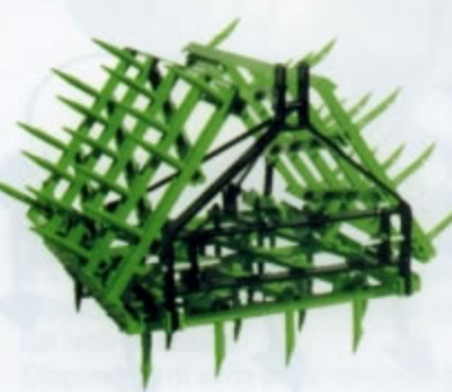
ERPICI A DENTI PORTATI serie leggera, media, pesante, super-pesante di serie da 40 a 60 denti larghezza da mt. 2,25 a mt.3,00 (da Kg.182 a Kg.420)