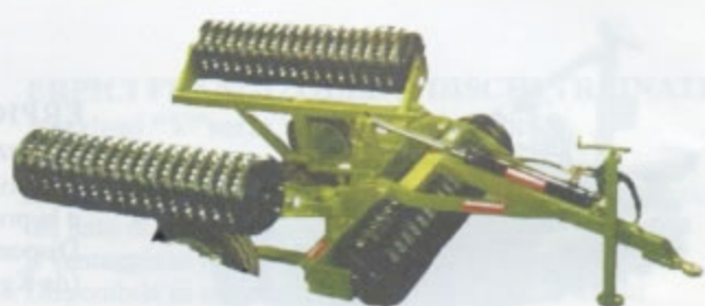
RULLI IN GHISA TRAINATI Larg. Mt.2,00 a mt. 3,00 Peso da Kg. 880 a Kg. 2.750