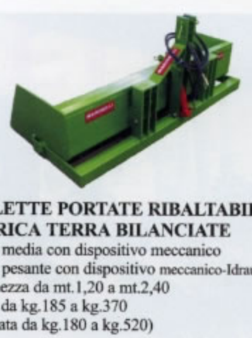
PALETTE PORTATE RIBALTABILI CARICA TERRA BILANCIATE serie media con dispositivo meccanico serie pesante con dispositivo meccanico-idraulico larghezza da mt.1,20 a mt.2,40 peso da kg.185 a kg.370 (portata da kg.180 a kg.520)