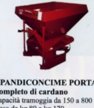
SPANDICONCIME PORTATO completo di cardano capacità tramoggia da 150 a 800 litri peso da kg.80 a kg.170