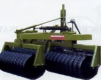
RULLI IN GHISA PORTATI Larg. Mt.2,00 a mt. 3,00 Peso da Kg. 580 a Kg. 1.200