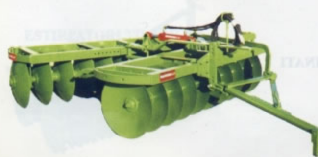
ERPICI FRANGIZOLLE A DISCHI TRAINATI a 2 sezioni "V" serie PMSPT (super pesante) Particolarmente adatto per la lavorazione su sodi e per terreni particolarmente compatti. Disponibile di serie nelle versioni: da 16 a 28 dischi ( da Kg.1.270 a Kg. 1.970)zavorrabili.