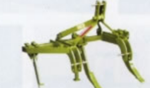
RIPPER SERIE MINI per TRATTORINI Da 25 - 40 CV