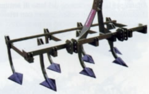
ESTIRPATORI PORTATI di serie da 7 a 9 ancore larghezza da mt. 1,90 a mt. 2,50 (da Kg.200 a Kg.440)