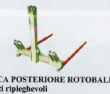
FORCA POSTERIORE ROTOBALLE a denti ripieghevoli larghezza da mt.1,00 a mt.1,50