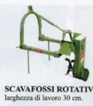
SCAFAFOSSI ROTATIVO larghezza di lavoro 30 cm.