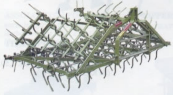
MINI VIBRO PORTATO Utilizzato per affinare il terreno e prepararlo alla semina. È possibile utilizzarlo nella posizione flottante (si adatta al terreno) o rigido. Polverizza il terreno. Disponibile nelle versioni da mt. 2,50 a mt. 4,00.