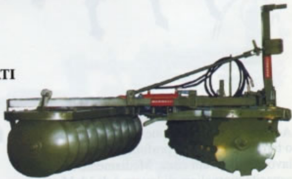
ERPICI FRANGIZOLLE A DISCHI PORTATI-TRAINATI a 2 sezioni "V" serie PMPPT (pesante) Adatto per terreni forti e compatti in vista della preparazione del letto di semina. Disponibile di serie: nelle versioni da 16 a 24 dischi (da Kg 940 a Kg 1.600) zavorrabili.