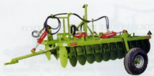
ERPICI FRANGIZOLLE A DISCHI TRAINATI 2 sezioni "V" serie "PMPPTL" (pesante) con trasporto longitudinale Adatto per terreni forti e compatti in vista della preparazione del letto di semina. È vantaggioso per il sistema di trasporto longitudinale. Disponibile di serie: nelle versioni da 20 a 28 dischi (da Kg 1.400 a Kg 1.900) zavorrabili.