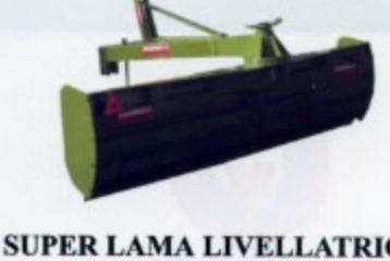
SUPER LAMA LIVELLATRICE larghezza da mt.2,20 a mt.2,50 peso da kg.400 a kg.450