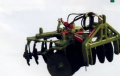
ERPICE FRANGIZOLLE A DISCHI PORTATO a 4 sez. Con doppio spostamento serie "RIX" Disponibile di serie nelle versioni da 12 a 16 dischi. Peso da Kg. 650 a Kg. 850.