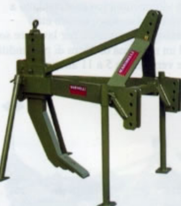
RIPPER MONOLAMA Serie RTM Peso da kg. 130 a kg.720 Profondità di lavoro da cm 20 a cm 100