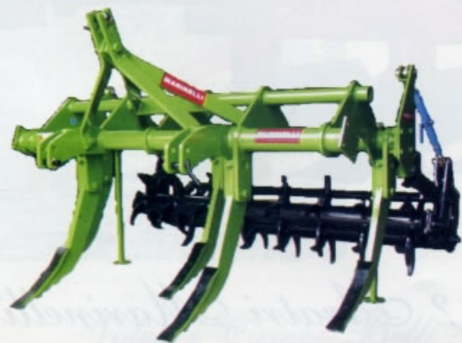
RIPPER SERIE RML-RMM-RMP Utilizzato per la lavorazione del terreno in alternativa all'aratro. Grazie alla sua compattezza e dimensioni viene particolarmente utilizzato sia in campo aperto sia in presenza di piantagioni (uliveti, frutteti, vigneti...) Con la possibilità di applicare ruote di profondità e doppio rullo.