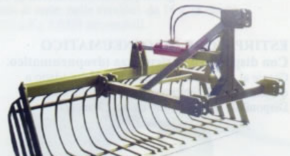
CESTA PER SASSI Apertura idraulica Larg. Da mt.1,40 a mt.2,30