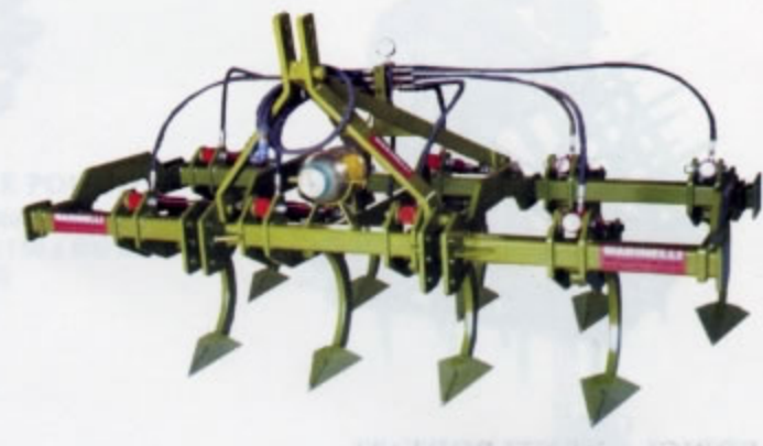
ESTIRPATORE IDROPNEUMATICO Con dispositivo di sicurezza idropneumatico. Grazie al sistema idropneumatico risulta adatto a qualsiasi tipo di terreno (sassoso, sciolto etc.) Disponibile nelle versioni da 5 a 13 ancore.