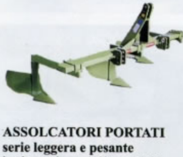
ASSOLCATORI PORTATI serie leggera e pesante larghezza da mt. 1,60 a mt.3,00 (da Kg.110 a Kg.180)