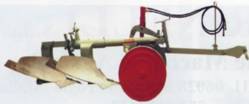
ARATRI TRAINATI SERIE "AUM" Disponibili nelle versioni: Monovomere e Bivomere. Per trattrici a cingoli fino a 120 CV.