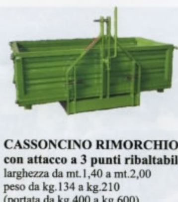
CASSONCINO RIMORCHIO con attacco a 3 punti ribaltabile larghezza da mt.1,40 a mt.2,00 peso da kg.134 a kg.210 (portata da kg.400 a kg.600)