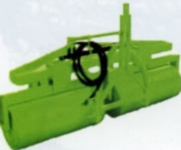
RULLI IN LAMIERA PORTATI Larg. Mt.2,00 a mt. 3,00 Peso da Kg. 160 a Kg. 910